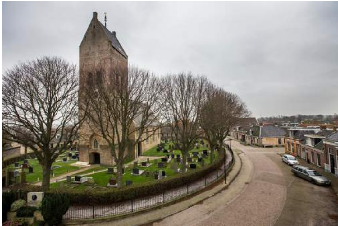
De kerk in Pingjum (Friesland).

Het zijn voornamelijk kerkgenootschappen die op zoek zijn naar een nieuwe ruimte. Zij maken bij Reliplan als eerste kans op een leegstaande kerk. "Veel van die genootschappen staan al geruime tijd bij ons ingeschreven. Anderen komen net kijken, zoals Syrische Orthodoxen. Door hen voorrang te geven, proberen we de kerk voor het oorspronkelijke doel te behouden."