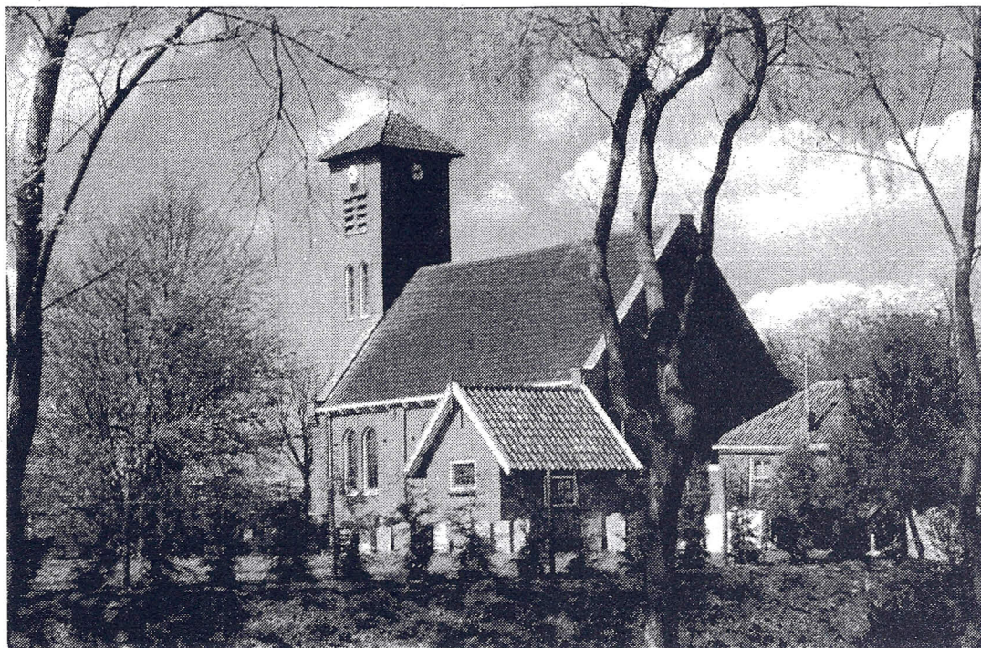
Het kerkje van Purmerland krijgt weer een toren die deels bestaat uit hout (zie tekening).

„Waarom we er zoveel geld in steken? Ik denk maar zo: als ik het zelf mooi vind, vinden anderen het vast ook mooi. Het is een investering die zichzelf terugverdient, die het gebouw aan-